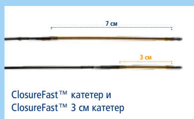
ClosureFast™ катетер и ClosureFast™ 3 см катетер

Экран монитора при использовании катетеров для эндовенозной радиочастотной абляции (РЧА) Covidien ClosureFast™ и Covidien ClosureFast™ 3 см